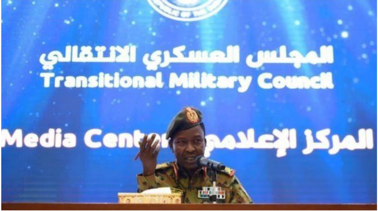
Sudan Askeri Geiş Konseyi sözcüsü Korgeneral Şemseddin Kebbaşı