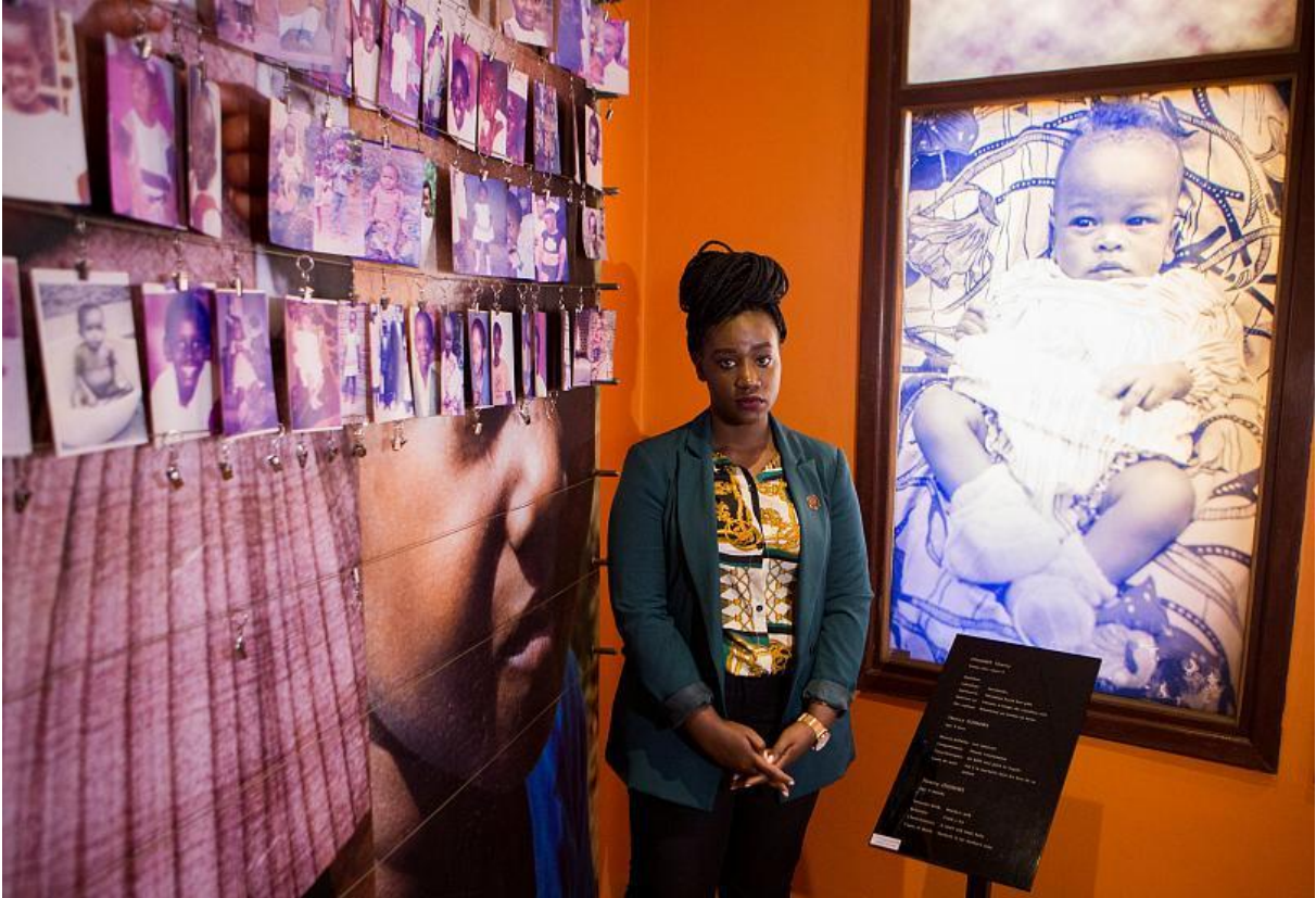
Fransa'da Ruanda Soykırımı için komisyon kuluyor

Aralık 1996: Ruanda'da ilk soykırım davası 'Ruanda için Uluslararası Ceza Mahkemesi' tarafından açıldı. (Bu mahkeme savaş suçu işleyenlerin yargılanması için Birleşmiş Milletler'in öncülüğünde kuruldu, çünkü Ruanda'daki yargı kurumları işlemez haldeydi.)